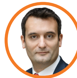
FLORIAN PHILIPPOT DÉPUTÉ FRANÇAIS AU PARLEMENT EUROPÉEN

la commission d'enquête sur les transports d'animaux vivants.