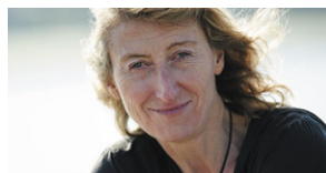
Catherine Chabaud Pays de la Loire Navigatrice