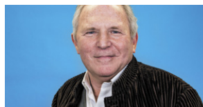
Bernard Guetta Île-de-France Journaliste, spécialiste des questions internationales