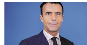
Sandro Gozi Pays de la Loire / Italie Ancien ministre, chargé des Affaires européennes, du gouvernement italien