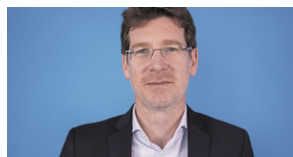
Pascal Canfin Île-de-France Ancien ministre, ancien député européen, ancien directeur général d'une ONG