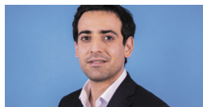
Stéphane Séjourné Nouvelle-Aquitaine Ancien conseiller d'Emmanuel Macron et directeur de campagne