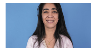
Nawel Rafik-Elmrini Grand Est Maire-adjointe de Strasbourg (67)