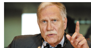
Dominique Riquet Hauts-de-France Député européen